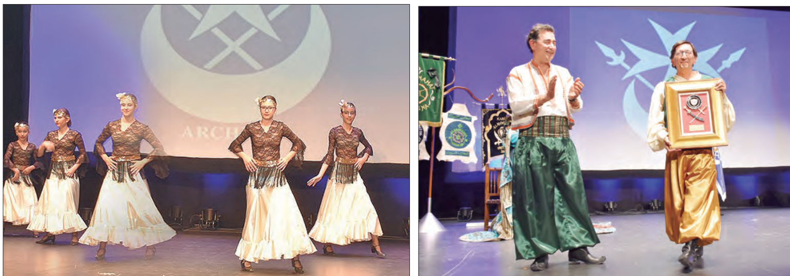
DIFERENTES IMÁGENES DE ESTE ACTO, QUE CONTÓ CON LA PRESENCIA DEL PRESIDENTE REGIONAL, FERNANDO LÓPEZ MIRAS