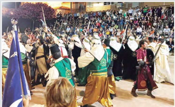
EN LAS IMÁGENES, DIFERENTES MOMENTOS DE LAS FIESTAS QUE SE HAN LLEVADO A CABO ESTAS ÚLTIMAS SEMANAS EN NUESTRA LOCALIDAD