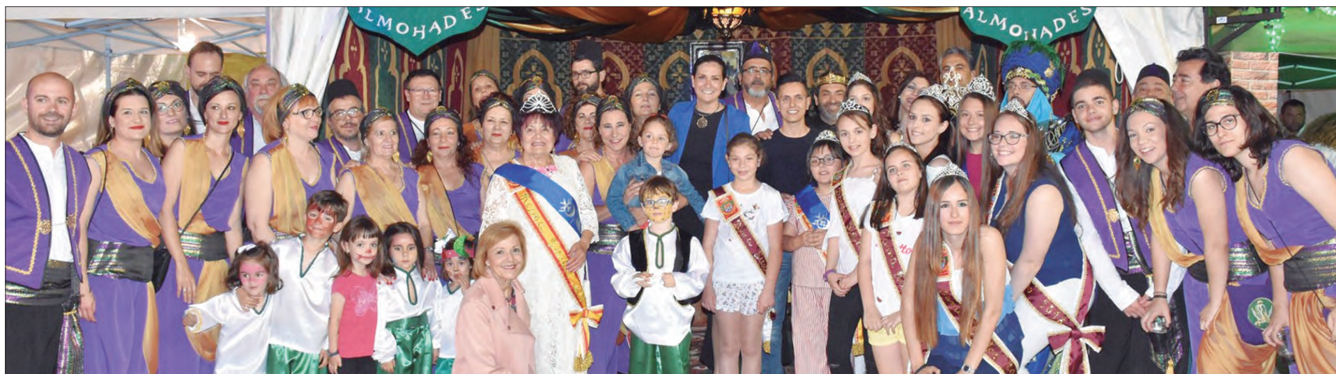
AUTORIDADES MUNICIPALES Y FESTERAS VISITARON TODAS Y CADA UNA DE LAS JAIMAS INSTALADAS EN ESTE CAMPAMENTO FESTERO

Este cortejo estuvo encabezado, un año más, por el Tío de la Pita y sus cabezudos.