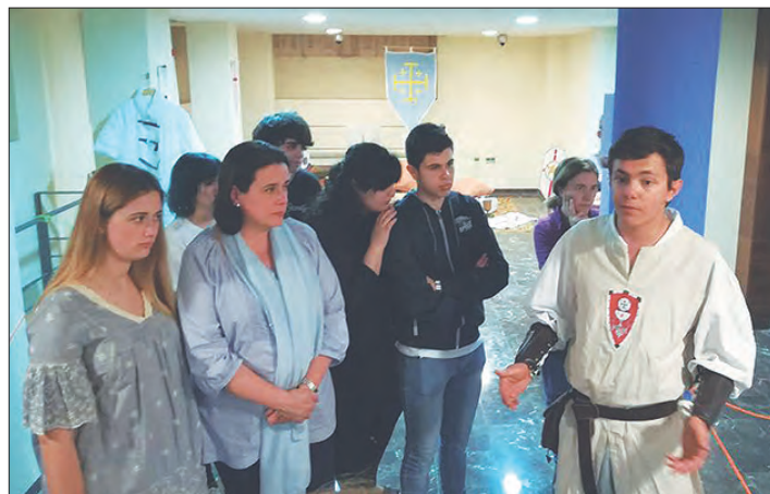
NOCHE INTERNACIONAL DE LOS MUSEOS. La Noche Internacional de los museos tuvo un gran

seguimiento en la localidad, abriéndose las puertas del Museo De Archena, Museo de