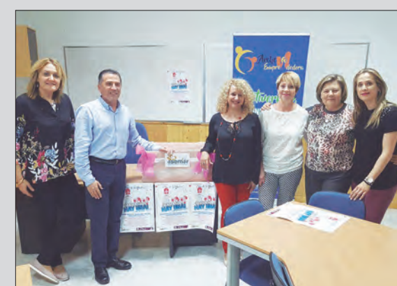
EL ACTO, CONTÓ CON LA ASISTENCIA DEL EDIL DE COMERCIO

alizarán en torno al viejo colegio Miguel Medina, y que también beneficiarán al comercio y al emprendimiento archenero.