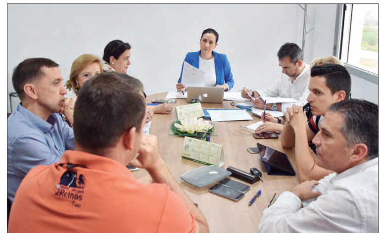
EN LA IMAGEN, REUNIÓN DONDE SE APROBÓ ESTE CONVENIO, QUE SE LLEVÓ A CABO EN LAS DEPENDENCIAS DE LA POLICÍA LOCAL

que asciende a 55.160 euros. El principal objetivo de los programas de atención temprana es que los niños que presentan trastornos en su desarrollo o tienen riesgo de padecerlos reciban todo aquello que, desde la vertiente preventiva y asistencial, pueda potenciar su capacidad de desarrollo y bienestar.