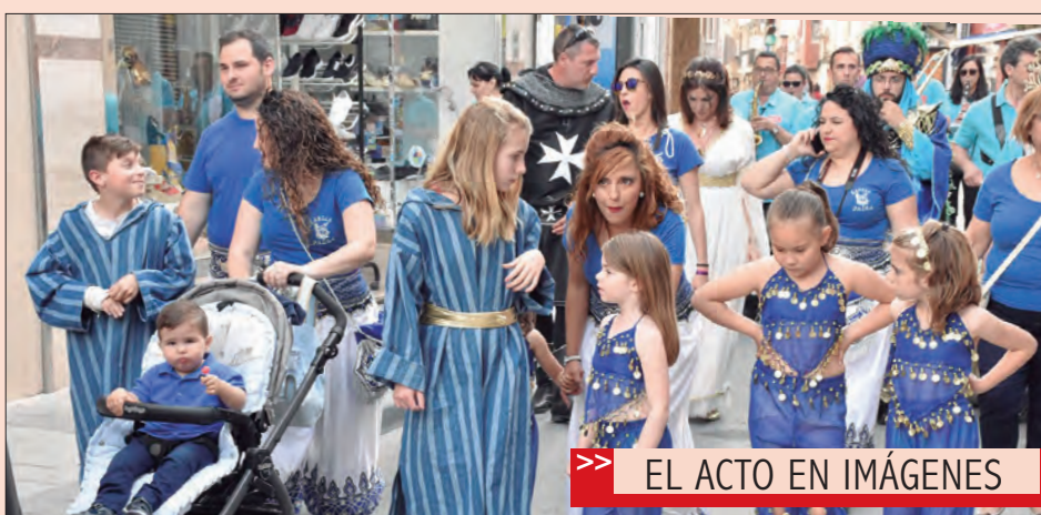
>> EL ACTO EN IMÁGENES