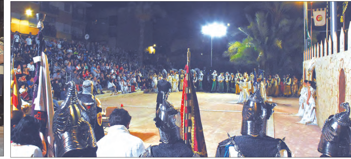
EN LAS IMÁGENES, DIFERENTES MOMENTOS DE ESTE ACTO QUE SIEMPRE CUENTA CON UN GRAN SEGUIMIENTO