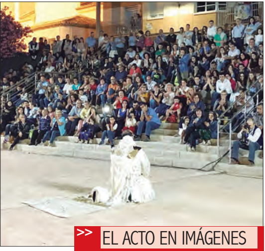
>> EL ACTO EN IMÁGENES