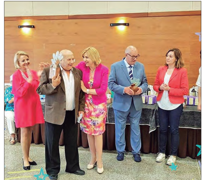
EN LAS IMÁGENES, MOMENTOS DE ESTE ACTO