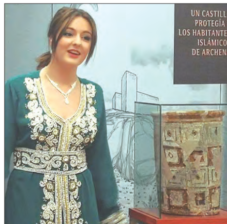
UN CASTILLO PROTEGÍA A LOS HABITANTES ISLÁMICOS DE ARCHENA

seguimiento en la localidad, abriéndose las puertas del Museo De Archena, Museo de