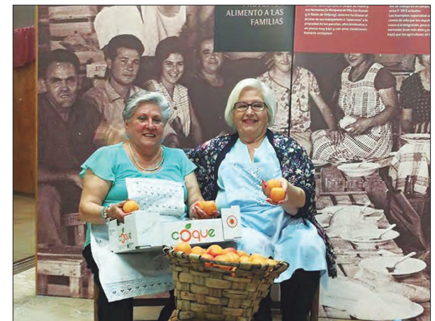
ALIMENTO A LAS FAMILIAS

Ntro. Padre Jesús Nazareno y Museo del esparto, con una exposición en su parte superior