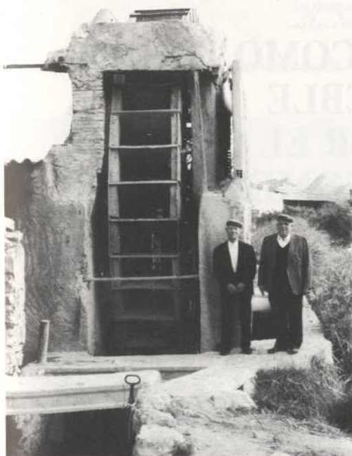
Noria de Los Chirriches

- Las Norias de Abarán - Unidad Didáctica N o 24 del CEP de Cieza, 1993.