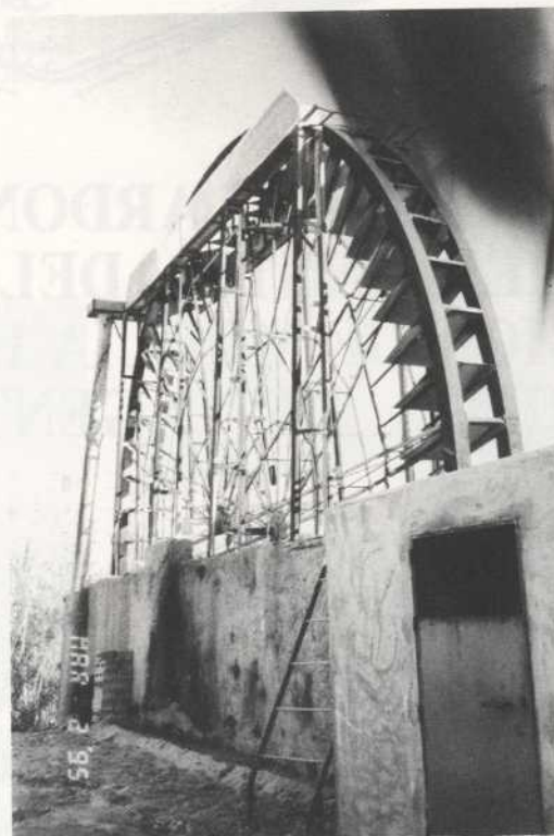
Noria de La Vicenta