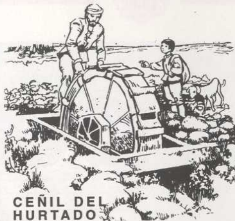
CEÑIL DEL HURTADO