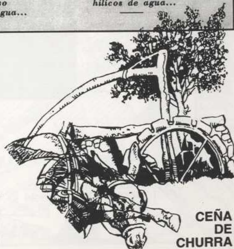
CEÑA DE CHURRA