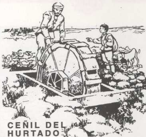
CEÑIL DEL HURTADO