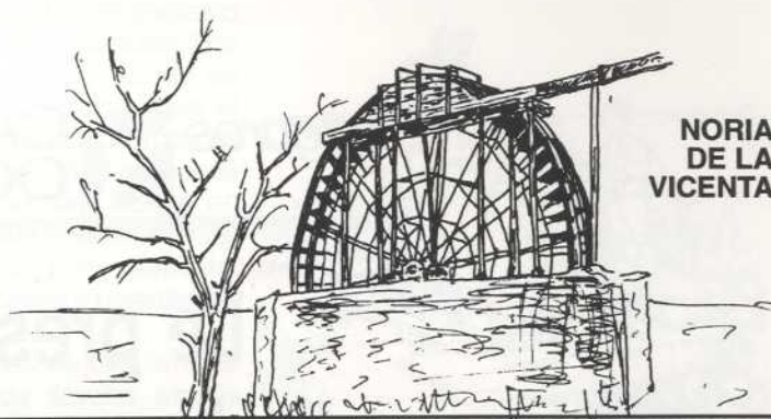
NORIA DE LA VICENTA

Las ceñas o ruedas de tiro o de sangre se situaban en puntos de escasa fuerza de agua; por lo general en pozos construidos junto a los brazales . La fuerza motriz era proporcionada por uno o dos animales de tiro. El burro y el buey eran los más comunes y en muchos casos los propios hortelanos sumaban su esfuerzo al del animal. Se trataba de una rueda de madera , ordinariamente de 14 palmos, con ' arcaduces o cangilones ' de madera, cuero, cerámica u hoja de lata, cojidos a una cuerda o cadena sin fin que colgaba de la rueda al fondo del pozo. Un engrane transversal de madera llamado ' linterna ' iba provisto en su eje de una viga para el enganche del animal.