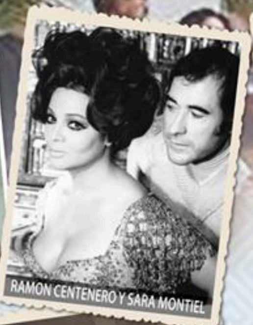
RAMON CENTENERO Y SARA MONTIEL