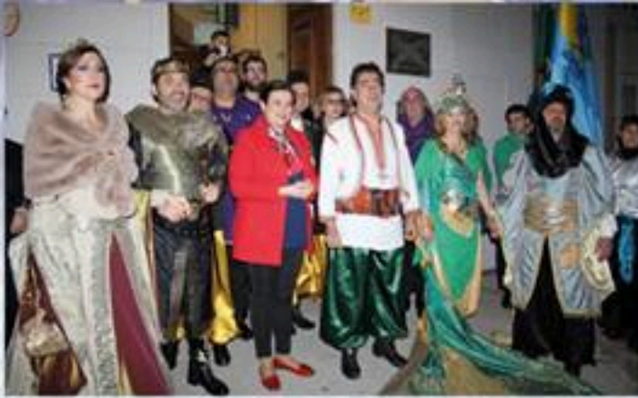
Inauguración de la Exposición.