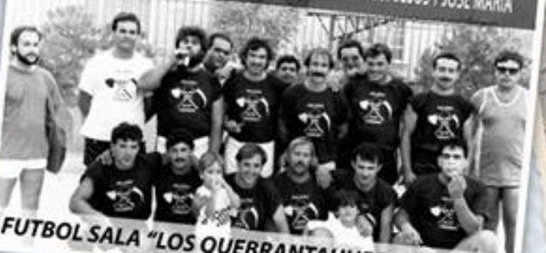
FUTBOL SALA "LOS QUEBRANTAHUESOS" (1985)