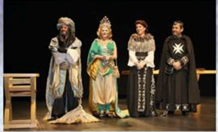
Embajadores Moro y Cristiano.