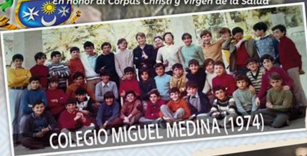
COLEGIO MIGUEL MEDINA (1974)

En honor al Corpus Christi y Virgen de la Salud