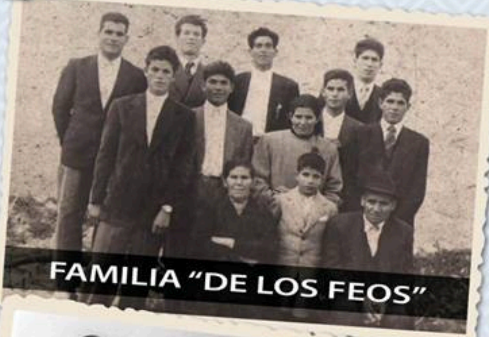
FAMILIA "DE LOS FEOS"