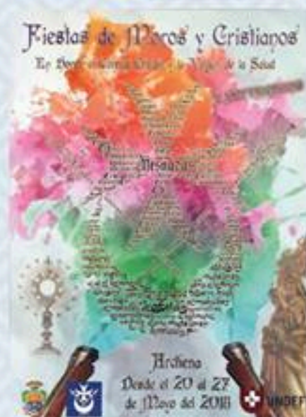
Cartel Festero 2018.

Nuestro agradecimiento al Ayuntamiento, su alcaldesa y concejales, y a todos nues-