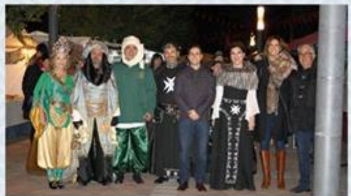
Mercadillo Medieval en el medio año festero.