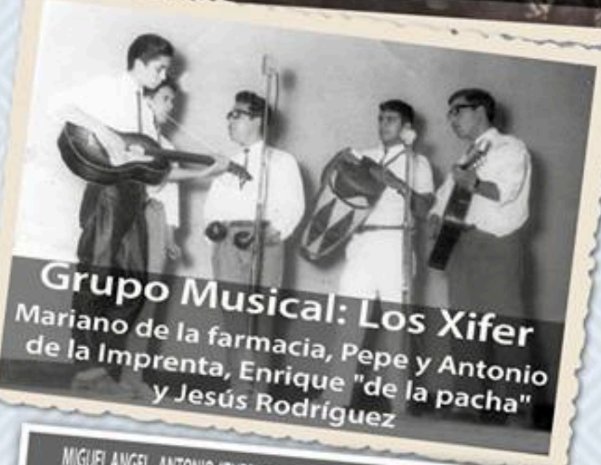
Grupo Musical: Los Xifer