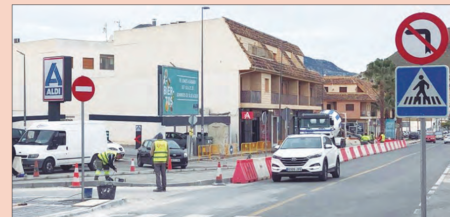
Cambios circulatorios por la aplicación del Plan de Tráfico y Movilidad Urbana del municipio. Conforme a dicho plan, desde hace una semana la calle Francisco Rabal es sólo de salida hacia la carretera de Villanueva del Río Segura y que desde esta carretera en ambos sentidos está prohibido girar hacia la calle Francisco Rabal.