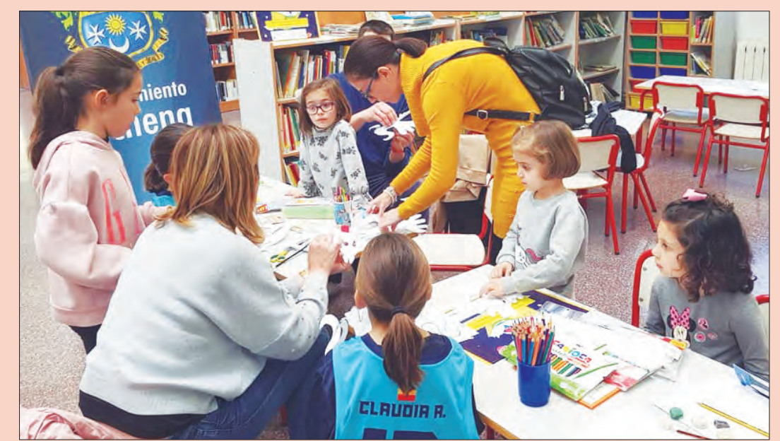
El pasado viernes, 31 de enero, desde las 16.30 hasta las 18.15h. se realizó el taller de animación a la lectura "Cuéntamelo otra vez" y un taller de manualidades por motivo del Día Internacional Escolar de la Paz y la No Violencia, en la Biblioteca Municipal "María Carmen Campoy García" de Archena.