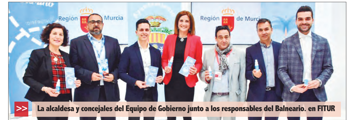
>> La alcaldesa y concejales del Equipo de Gobierno junto a los responsables del Balneario. en FITUR

EN LA FERIA INTERNACIONAL DE TURISMO (FITUR)