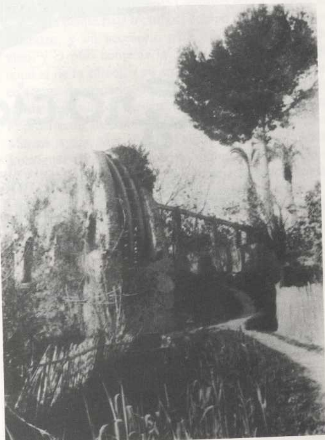
Noria del Matar