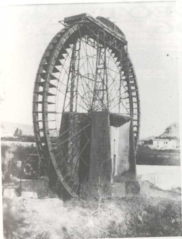
Noria de Las Arboledas