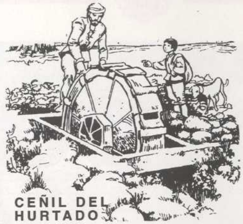
CEÑIL DEL HURTADO