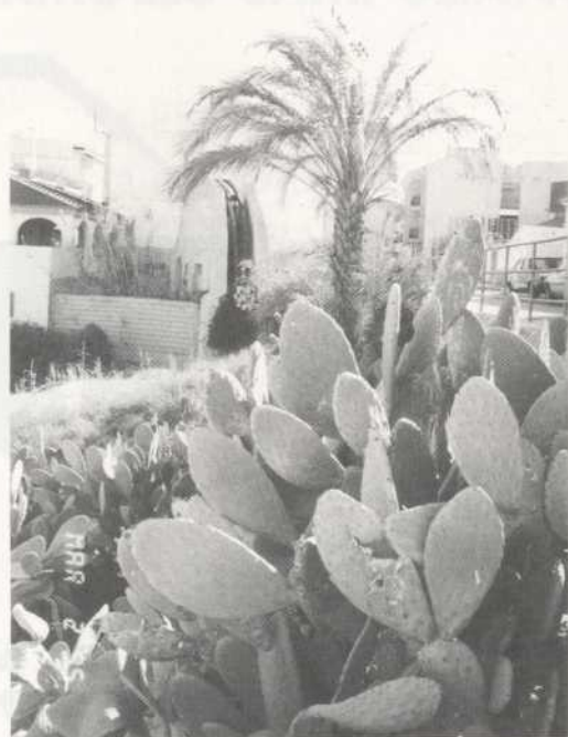
Noria del Matar