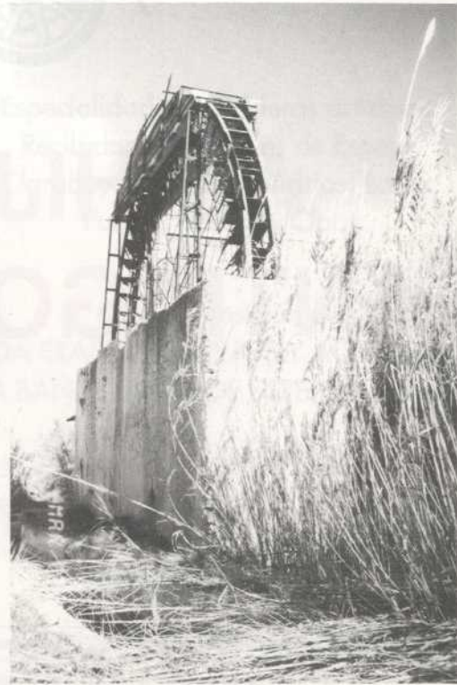
Noria del Acebuche

La Noria de Archena. Partido del Barranco. Rueda hidráulica. bancoas.