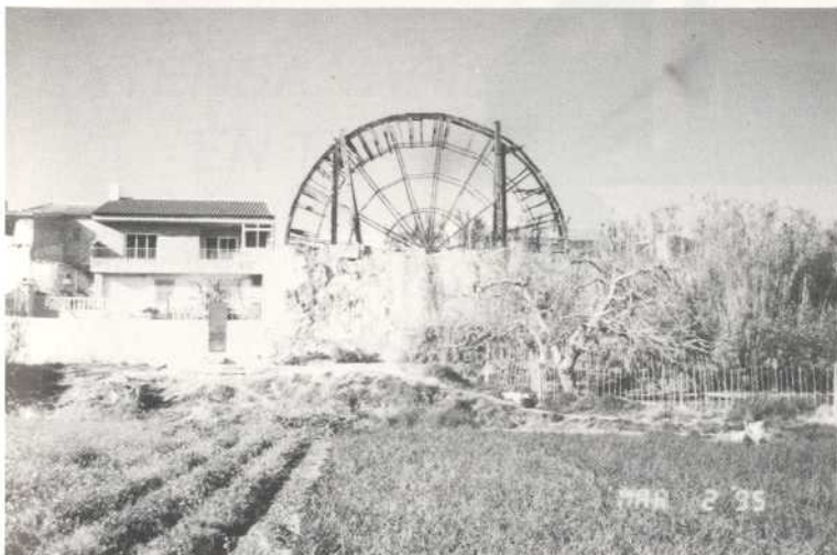
Noria de la Cierva