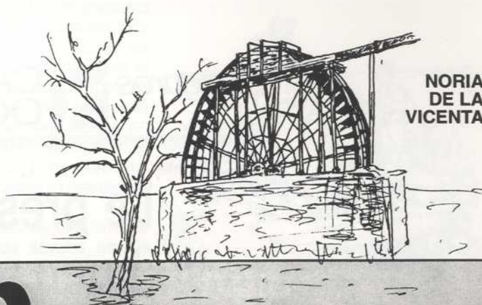
NORIA DE LA VICENTA

Las ceñas o ruedas de tiro o de sangre se situaban en puntos de escasa fuerza de agua; por lo general en pozos construidos junto a los brazales . La fuerza motriz era proporcionada por uno o dos animales de tiro. El burro y el buey eran los más comunes y en muchos casos los propios hortelanos sumaban su esfuerzo al del animal. Se trataba de una rueda de madera , ordinariamente de 14 palmos, con ' arcaduces o cangilones ' de madera, cuero, cerámica u hoja de lata, cojidos a una cuerda o cadena sin fin que colgaba de la rueda al fondo del pozo. Un engrane transversal de madera llamado ' linterna ' iba provisto en su eje de una viga para el enganche del animal.